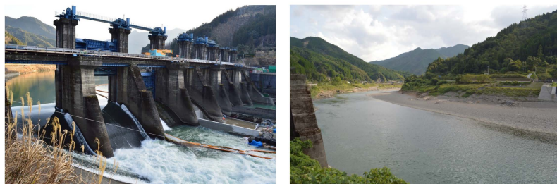
Before (right) and after (left) the removal of the Arase Dam