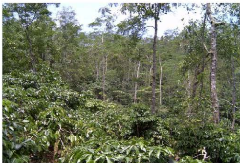
Left: Agroforestry in Central Java, Indonesia