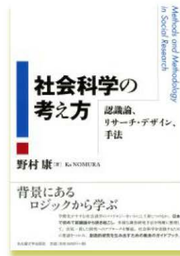
Right: Textbook on research methodology